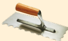
Spatola 28x12 cm dente tondo 15 mm INOX