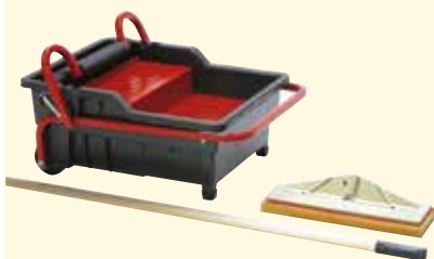
Vaschetta lavaggio c/pedalò + frattazzo c/manico