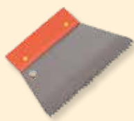
Spatola 6x6 mm