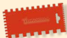
Spatola in PVC

Nel caso di piccoli avvallamenti bisognerà ripristinare la planarità.