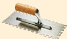
Spatola 28x12 cm dente quadro 10 mm INOX