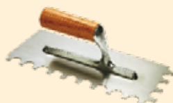
Spatola 28x12 cm dente tondo Ø 15 mm INOX

stabile, privo di parti facilmente asportabili, non deformabile, stagionato, esente da contaminanti come sporco, olio, grasso, disarmante, lattime, efflorescenze, vecchi rivestimenti e altri trattamenti della superficie. I supporti cementizi non devono essere soggetti a ritiri successivi alla posa del prodotto, pertanto devono essere correttamente stagionati. Rispettare quanto previsto dalla normativa vigente. A seconda delle condizioni del substrato e dei contaminanti da rimuovere dalla superficie, eseguire adeguate tecniche di preparazione, come il lavaggio ad alta pressione, abrasione meccanica o sabbiatura a secco, per rimuovere ogni traccia di materiali che potrebbero ridurre l'adesione del prodotto al substrato.