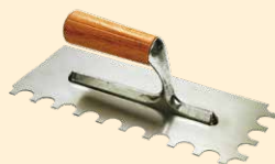
Spatola 28x12 cm dente tondo Ø 15 mm INOX