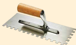
Spatola 28x12 cm dente quadro 10 mm INOX