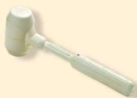
Martello di gomma bianca