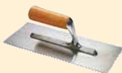
Spatola 28x12 cm dente quadro 8 mm INOX