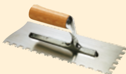
Spatola 28x12 cm dente quadro 10 mm INOX