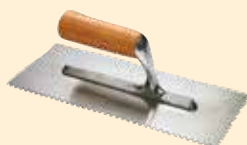
Spatola dente quadro 8 mm INOX