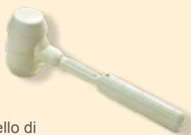
Martello di gomma bianca