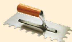
Spatola dente tondo Ø 15 mm INOX