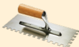
Spatola dente quadro 10 mm INOX