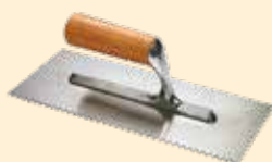
Spatola 28x12 cm dente quadro 8 mm INOX