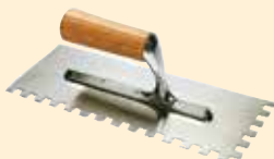
Spatola 10x10 mm