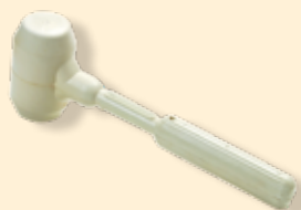
Martello di gomma bianca