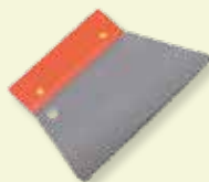
Spatola INOX 3x3 mm dente triangolare