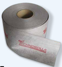
Bandella RL 120