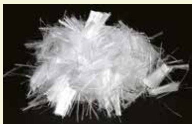
Fibra sintetica per massetti