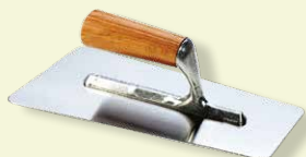
Spatola liscia 28x12 cm