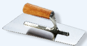
Glatter Spachtel 28x12 cm