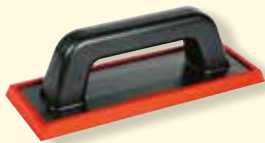
Spachtel aus Gummi