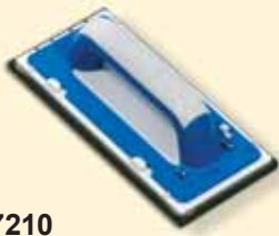
437210 Spachtel mit Moosgummi