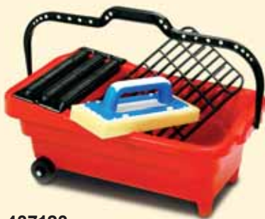
437123 Reinigungsbehälter 3 Walzen