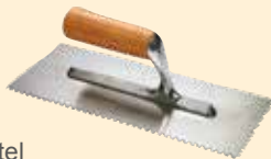
Spachtel Rechteckzahnung 8 mm Edelstahl