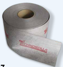
Dichtband RL 120