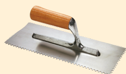
Spatola 8x8 mm