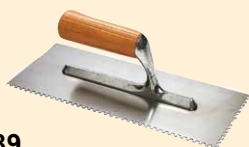
437189 Spachtel 28x12 cm Rechteckzahnung 8 mm Edelstahl