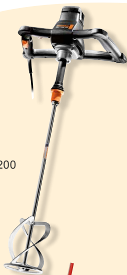
437145 Rührgerät 1200