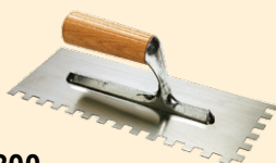
437200 Spachtel 28x12 cm Rechteckzahnung 10 mm Edelstahl