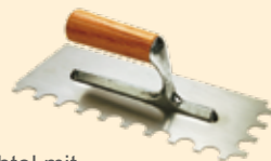
Spachtel mit Rundzahnung Ø 15 mm