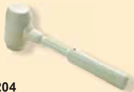
437204 Weißer Gummihammer