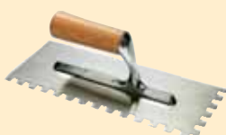
437200 Spachtel 10x10 mm

verwenden, weil eine sehr hohe Geschwindigkeit die mechanischen Eigenschaften des Produkts beeinträchtigt. Etwa 5-10 Minuten ruhen lassen, noch einmal kurz aufrühren und mit dem Verlegen beginnen. Das so erhaltene Produkt ist eine cremige, gut mit dem Spachtel aufzutragende Masse mit sehr guter Thixotropie.