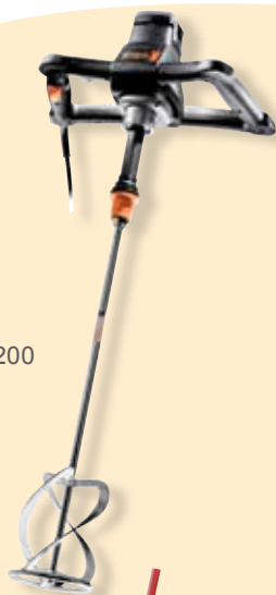
437145 Rührgerät 1200