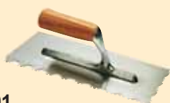
437201 Spachtel 28x12 cm Rundzahnung 15 mm Edelstahl