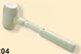
437204 Weißer Gummihammer