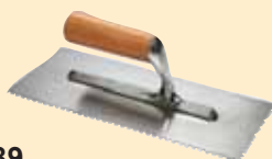
437189 Spachtel 28x12 cm Rechteckzahnung 8 mm Edelstahl