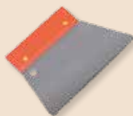
Spachtel 3x3 mm