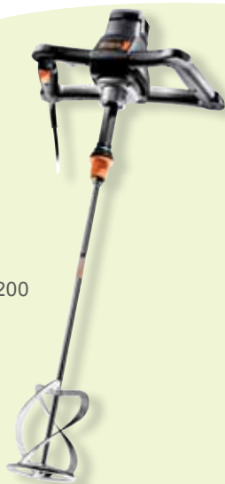
437145 Rührgerät 1200